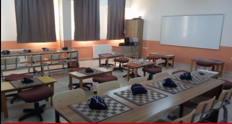
Zeka Oyunları Sınıfı