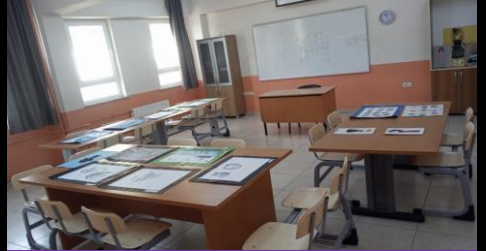
Görsel Sanatlar Atölyesi